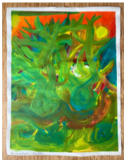
ROB OUD BEZOEKER