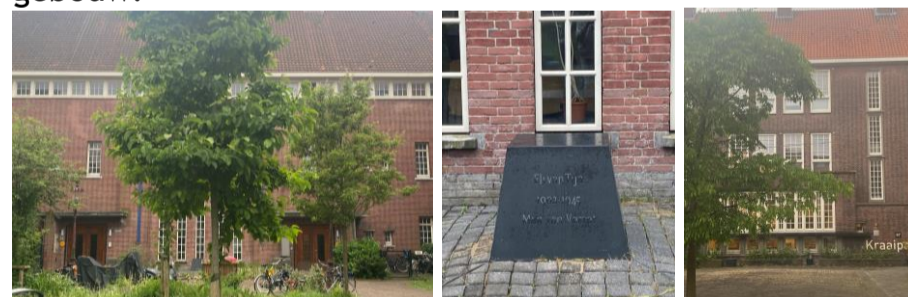
Huidige Kraaipan & monument Eli van Tijn

Woningcorporatie Ymere heeft de voormalige school uiteindelijk verbouwd tot een multifunctioneel gebouw voor zorg en maatschappelijke activiteiten. Zo zijn er woningen, een wijkservicepunt, een dagcentrum voor ouderen met klachten van vergeetachtigheid en een buurtrestaurant aanwezig. Diverse maatschappelijke organisaties zijn hier actief, waaronder Dynamo, ZGAO & KraaipanOase, met een vast aanbod van activiteiten voor (buurt)bewoners. Buiten het gebouw staat nog het monument ter herinnering aan schoolhoofd Eli van Tijn en de Joodse geschiedenis van het gebouw.