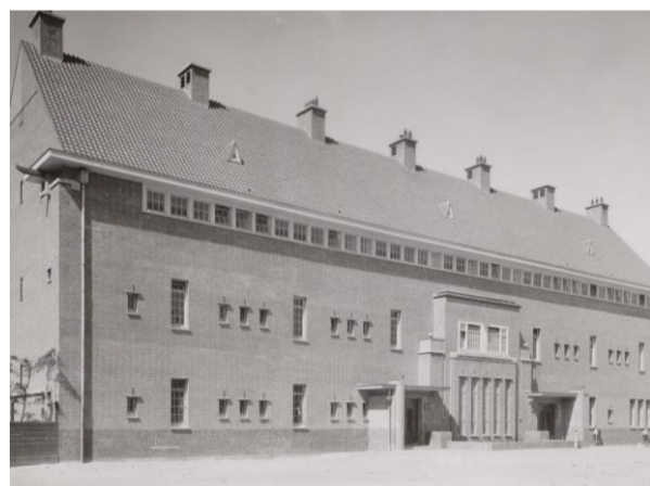
Links Talmud Toraschool; rechts Joodse school 9

Sinds 1935 zat de Talmud Toraschool B in het schoolgebouw, gelegen in de meest Joodse buurt van Amsterdam. Aangezien er al een Talmud Toraschool bestond in de Tweede Boerhaevestraat, kreeg de school in de Kraaipanstraat de toevoeging 'B' om onderscheid te maken. Naast reguliere vakken werden religieuze vakken en Hebreeuws onderwezen. Ook werden de Joodse feestdagen gevierd. Na de grote razzia's, onaangekondigde klopjachten waarbij in korte tijd groepen mensen werden opgepakt, in juni 1943 werd de school gesloten. Alle leerlingen en leerkrachten waren verdwenen. De meesten werden gedood in concentratiekampen in het Oosten.